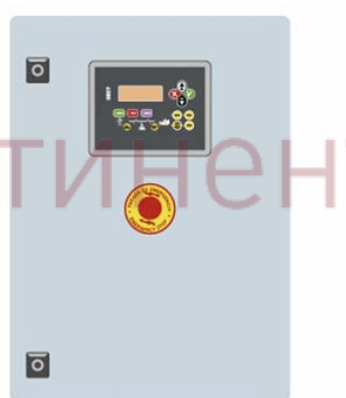
Внешний шкаф автоматического ввода резерва КОНТРОЛЛЕР СЕС7