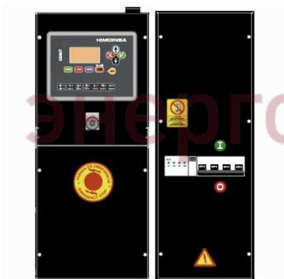
Панель управления ДГУ КОНТРОЛЛЕР СЕМ7