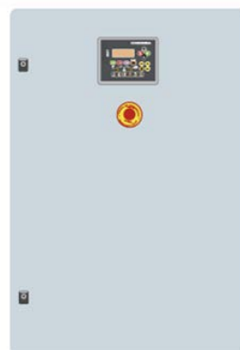
Внешний шкаф управления ДГУ с автоматическим вводом резерва КОНТРОЛЛЕР СЕА7