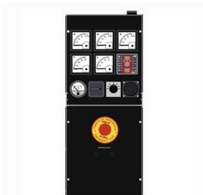
Панель ручного управления ДГУ

* В случае автоматизации с применением контроллера СЕС7, ДГУ с панелью М6 должна быть оборудована подзарядным устройством АКБ (опция).