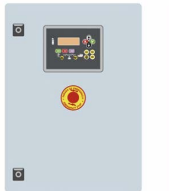
Внешний шкаф автоматического ввода резерва КОНТРОЛЛЕР СЕС7