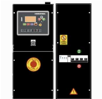
Панель управления ДГУ с автоматическим вводом резерва КОНТРОЛЛЕР СЕА7