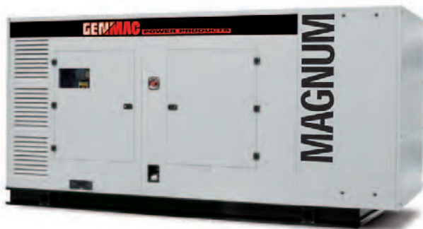
Изображение только для иллюстрации