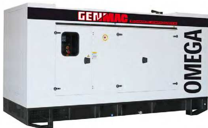
Изображение только для иллюстрации