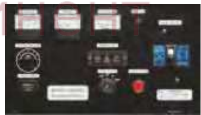
Панель управления: YEG450DSLS Панель управления: YEG450DTLS