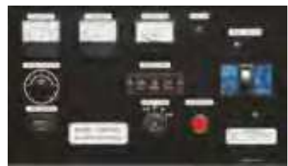
Панель управления: YEG500DSHC Панель управления: YEG500DTHC